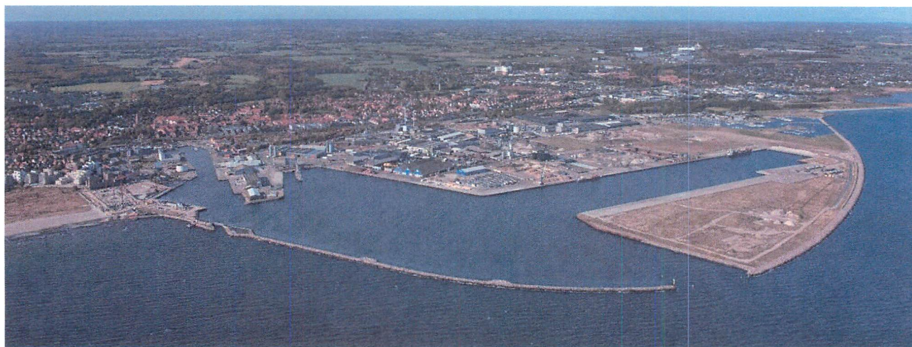
Køge Ny Nordhavn – Nye anlæg er færdiggjort og flere er på vej.

Køge Havn har i 2022 oplevet en større og større efterspørgsel omkring skibsanløb og ikke mindst muligheden for at lokalisere sig mere permanent på området. Dette gør, at direktionen er meget opmærksomme på, hvilke forretningsområder der prioriteres. Udover havnens mere normale forretningsområder som sten, grus og skrot, samt andre bulk produkter der viser stor organisk vækst, så vil det fremtidige fokus rette sig mod forretningsområder, der understøtter den grønne omstilling samt muligheden for yderligere færgeruter og speciallast.